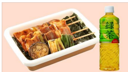
ハセガワストア やきとり弁当(中・タレ)セット