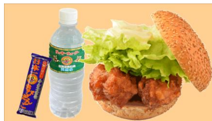
ラッキーピエロ チャイニーズチキンバーガーセット